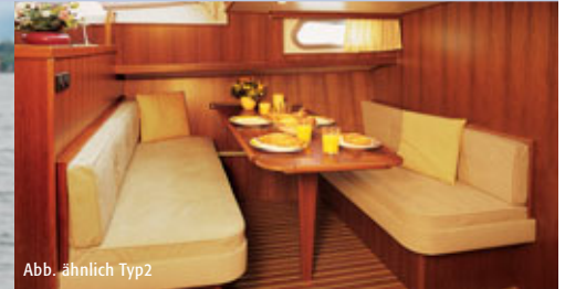
Abb. ähnlich Typ2

Diese Weltpremiere ist erstmalig für Yachtcharter-Schulz gefertigt worden. Der Typ1 bietet super Komfort für 8 bis 10 Personen in 4 abgeschlossenen Kabinen mit sehr viel Stauraum. Der neuartige Rumpfbau verleiht dem Schiff erstklassige Fahreigenschaften. Im Achterbereich ist je Kabine ein Doppelbett für 2 Personen plus darüberliegendem Etagenbett. Bei weniger als 8 Personen dient diese Fläche als bequeme Ablage. Typ2 bietet maximalen Komfort für 4 Personen in 2 Kabinen, 1x WC u. Du., 1x WC, 1x Du.