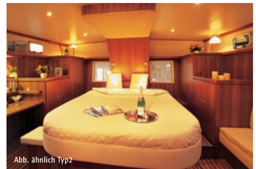
Abb. ähnlich Typ2

Fon: (0 39 91) 12 14 15 www.bootsurlaub.de